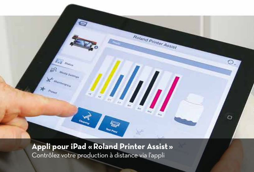
Appli pour iPad « Roland Printer Assist » Contrôlez votre production à distance via l'appli

La RF-640 utilise l'encre ECO-SOL MAX 3 de Roland en quatre couleurs. Cette encre certifiée GREENGUARD Gold vous garantira de splendides couleurs vives. Les couleurs sont reflétées dans les têtes d'impression qui déchargent les gouttelettes d'encre en sept tailles différentes. Le résultat : des impressions stupéfiantes sur un grand éventail de supports. Vous pouvez même vous attendre à une belle qualité d'impression à des vitesses d'impression élevées.