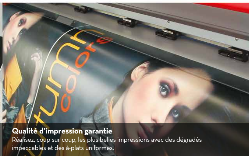
Qualité d'impression garantie Réalisez, coup sur coup, les plus belles impressions avec des dégradés impeccables et des à-plats uniformes.